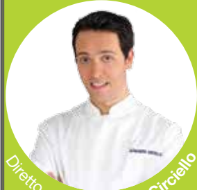
Diretto da Alessandro Circiello