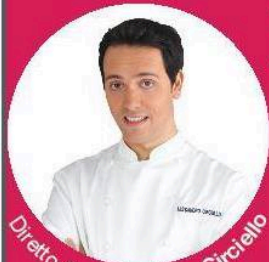
Diretto da Alessandro Circiello